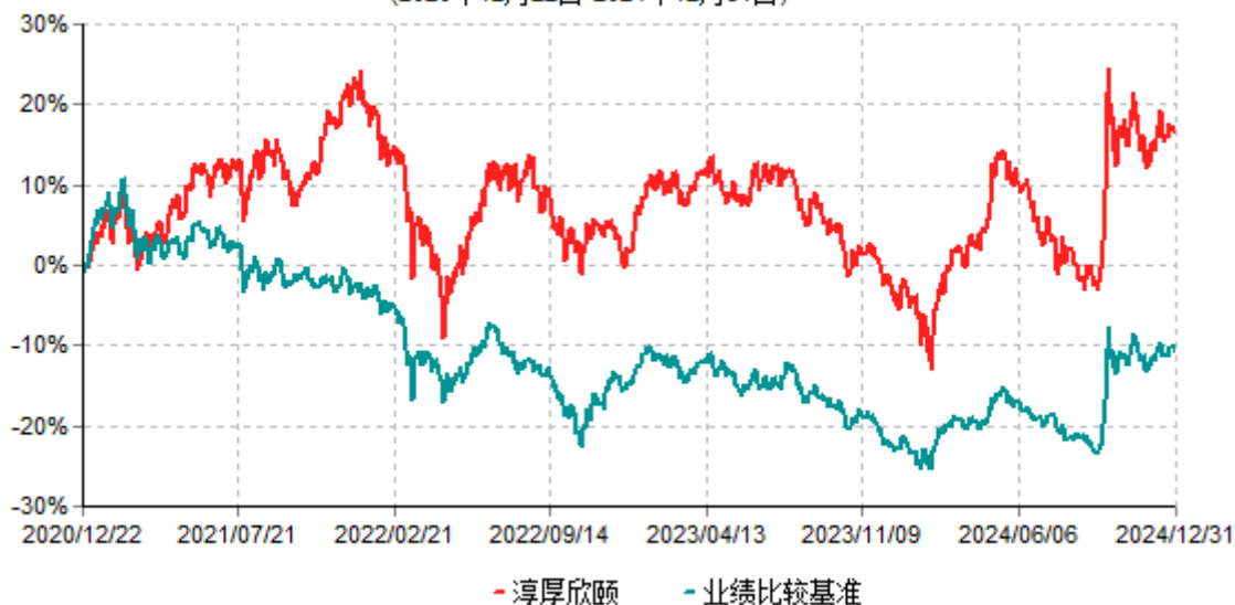
淳厚欣颐累计净值增长率与业绩比较基准收益率历史走势对比图 (2020年12月22日-2024年12月31日)

注：本基金基金合同生效日为2020年12月22日。按基金合同规定，本基金自基金合同生效起6个月内为建仓期。建仓期结束时本基金的各项投资比例均符合基金合同约定。