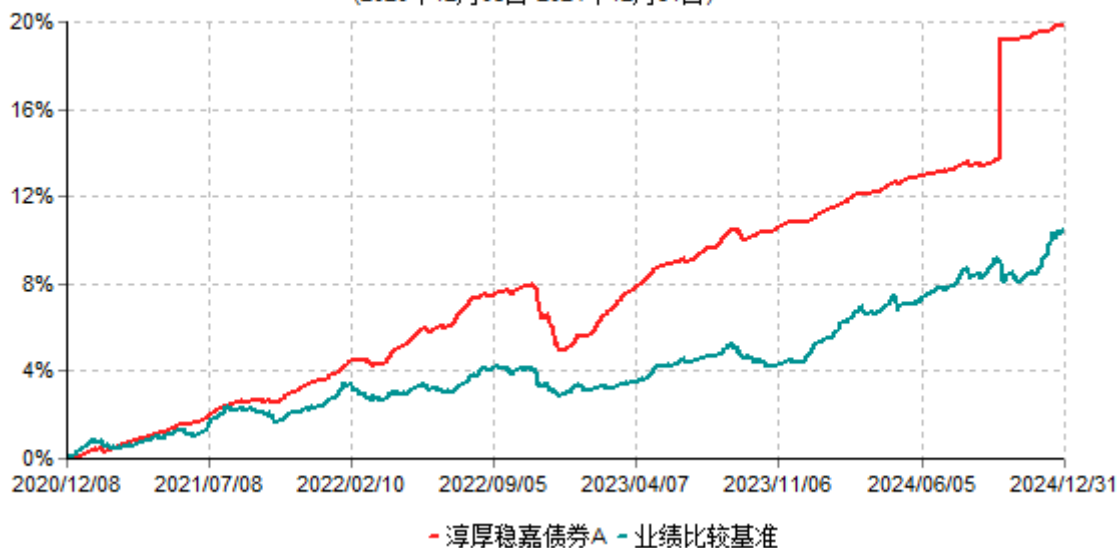
淳厚稳嘉债券A累计净值增长率与业绩比较基准收益率历史走势对比图 (2020年12月08日-2024年12月31日)

注：本基金基金合同生效日为2020年12月8日。按基金合同规定，本基金自基金合同生效起6个月内为建仓期。建仓期结束时本基金的各项投资比例均符合基金合同约定。