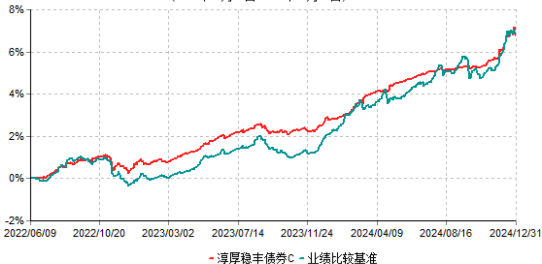
淳厚稳丰债券C累计净值增长率与业绩比较基准收益率历史走势对比图 (2022年06月09日-2024年12月31日)

注：本基金基金合同生效日为2022年06月09日。按基金合同规定，本基金自基金合同生效起6个月内为建仓期。建仓期结束时本基金的各项投资比例均符合基金合同约定。