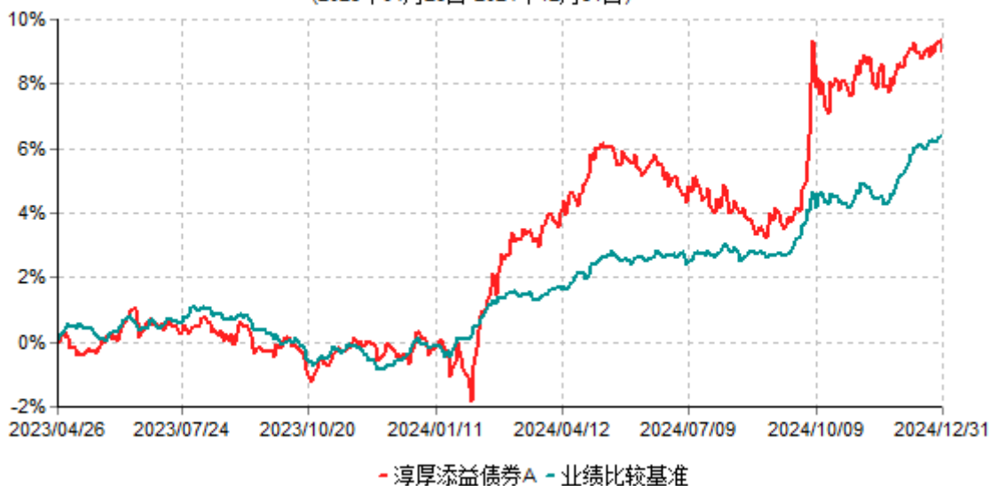
淳厚添益债券A累计净值增长率与业绩比较基准收益率历史走势对比图 (2023年04月26日-2024年12月31日)

注：本基金基金合同生效日为2023年4月26日。按基金合同规定，本基金自基金合同生效起6个月内为建仓期。建仓期结束时本基金的各项投资比例均符合基金合同约定。