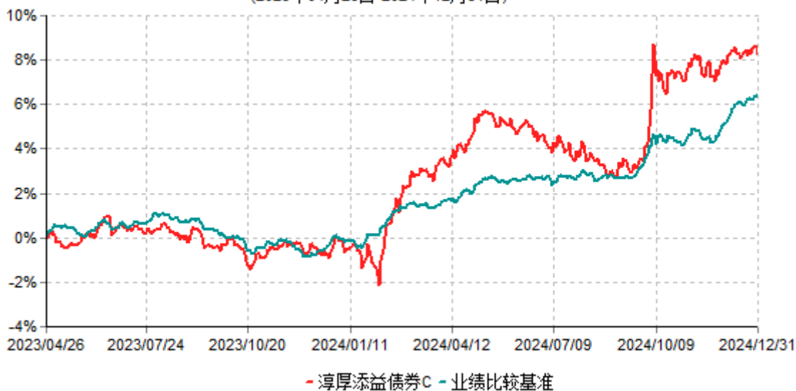
淳厚添益债券C累计净值增长率与业绩比较基准收益率历史走势对比图 (2023年04月26日-2024年12月31日)

注：本基金基金合同生效日为2023年4月26日。按基金合同规定，本基金自基金合同生效起6个月内为建仓期。建仓期结束时本基金的各项投资比例均符合基金合同约定。