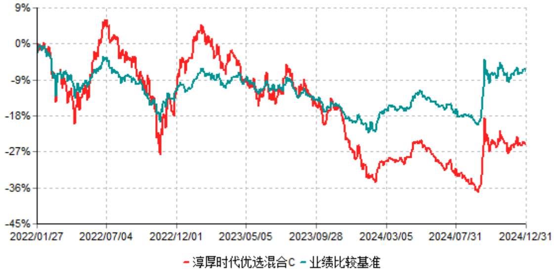
淳厚时代优选混合C累计净值增长率与业绩比较基准收益率历史走势对比图 (2022年01月27日-2024年12月31日)

注：本基金基金合同生效日为2022年1月27日。按基金合同规定，本基金自基金合同生效起6个月内为建仓期。建仓期结束时本基金的各项投资比例均符合基金合同约定。