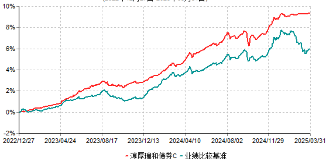
淳厚瑞和债券C累计净值增长率与业绩比较基准收益率历史走势对比图 (2022年12月27日-2025年03月31日)

注：本基金基金合同生效日为 2022 年 12 月 27 日。按基金合同规定，本基金自基金合同生效起 6 个月内为建仓期。建仓期结束时本基金的各项投资比例均符合基金合同约定。