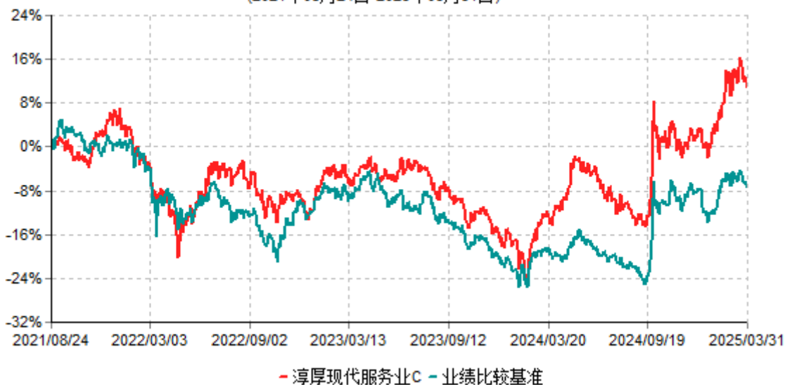
淳厚现代服务业C累计净值增长率与业绩比较基准收益率历史走势对比图 (2021年08月24日-2025年03月31日)

注：本基金基金合同生效日为 2021 年 08 月 24 日。按基金合同规定，本基金自基金合同生效起 6 个月内为建仓期。建仓期结束时本基金的各项投资比例均符合基金合同约定。